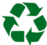
Anneau de Moebius